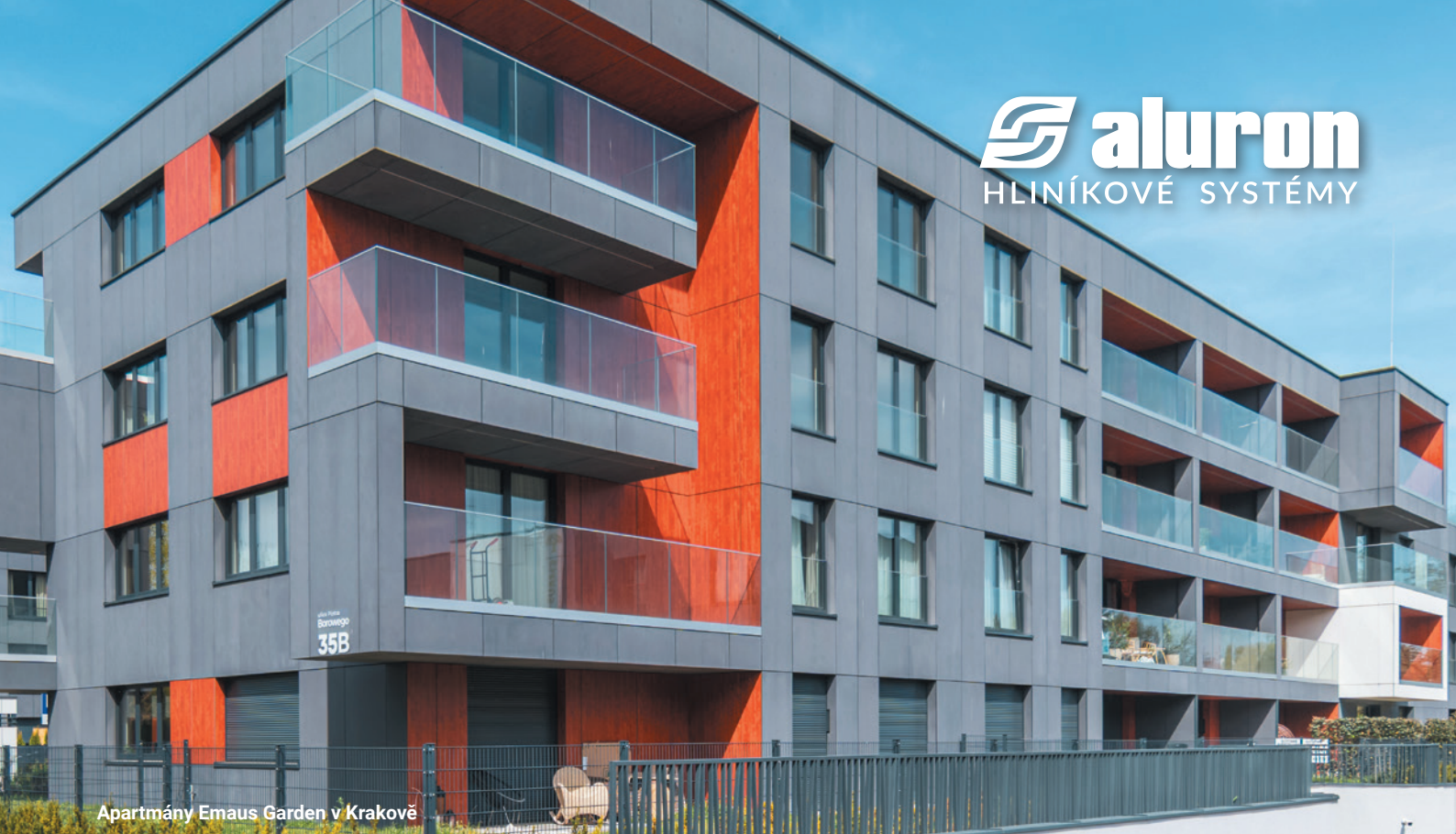
Apartmány Emaus Garden v Krakově