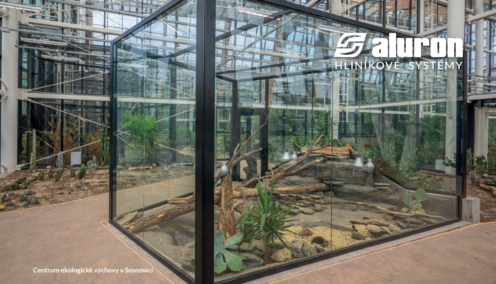
Centrum ekologické výchovy v Sosnowci